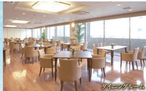
ダイニングルーム